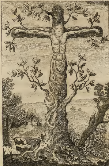
Verdadera Efigie del Arbol que en figura de Cruz, y Crucifijo se halló en el Valle de Lumache, Reino de Chile año de 1636